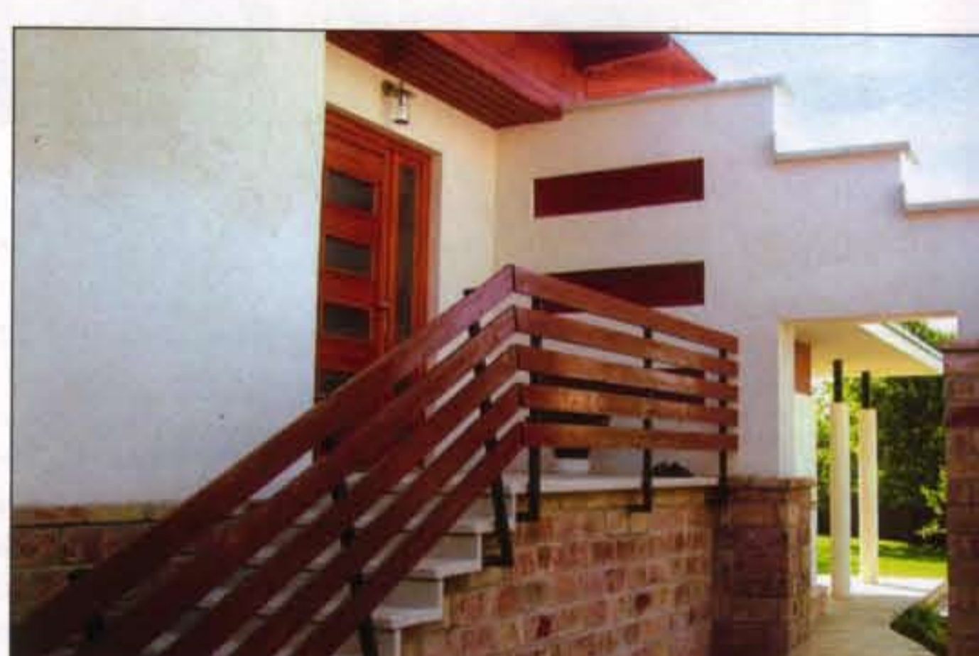
14 | A Mi Otthonunk | Háznéző

A telken egy 1960-70-es években épület sátozottos - szovjet mintából átvett - lakóház uralta a terepet, amely másfél méteres padlómagasságával a terepszint fölé magasodott. A meglévő házat a megrendelő nem kívánta elbontani, ebből következett a szinteltolások forma, mivel célszerű volt, hogy a nappali rész is közvetlenül tudjon csatlakozni a kerthez. Az utca felé zárt épület a kert irányában megnyílik, a nagyméretű üvegfalon keresztül befolyik a kert a házba. A nappali-étkezőhöz tartozó teraszon egyszerre megtalálható az árnyékos és a napsütötte rész is. A nappali és az étkező tér közötti 1,5 méteres szintkülönbséget enyhén íves lépcső hidalja át. A nappali és az éjszakai zóna jól elkülönül, a nappali, étkező, konyha, előszoba szintén önálló életet él. Az épület külső anyaghasználatára a természetes anyagok jellemzőek, égetett agyagtégla, faburkolatok, cserépfedés, és a nagyméretű deszka teraszok. A ház külső formáját is meghatározza a szinteltolások kialakítás, amely a régi épület átépítéséből adódik.